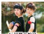
反対側の腕に 命を装着する