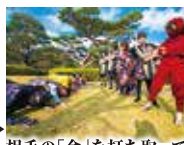
相手の「命」を打ち取って 自軍の勝利に貢献せよ!