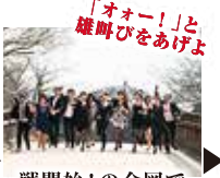
「オー！」と 雄略びをあげよ