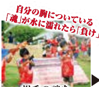
相手の魂を 狙って戦おう!